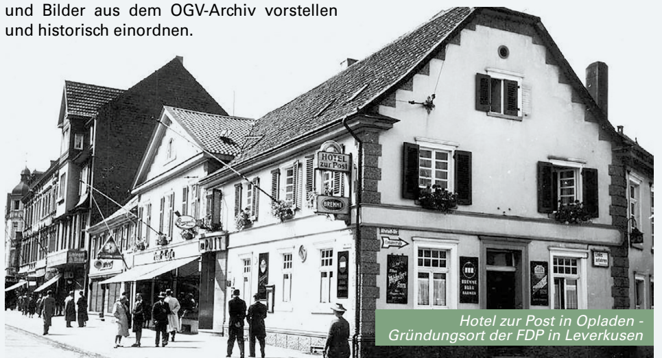
Hotel zur Post in Opladen - Gründungsort der FDP in Leverkusen

Diese lokale Geschichte steht exemplarisch für die Neuformierung demokratischer Strukturen nach dem Ende der nationalsozialistischen Diktatur. Sie zeigt, wie politische Ideen und Engagement aus der Stadtgesellschaft heraus neu entstanden. Zugleich schlägt das Archivdokument eine Brücke zur L Leverkusener Geschichtsmatinee , die sich dem demokratischen Neubeginn im Raum Leverkusen nach 1945 widmet. In künftigen Ausgaben des Infobriefs werden wir regelmäßige Dokumente und Bilder aus dem OGV-Archiv vorstellen und historisch einordnen.