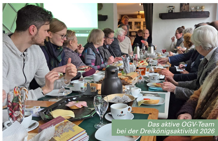
Das aktive OGV-Team bei der Dreikönigsaktivität 2026

→ Veranstaltungskalender auf der Rückseite