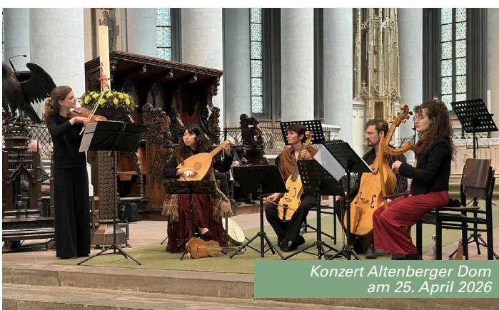
Konzert Altenberger Dom am 25. April 2026

Die Veranstaltungen zeigen erneut, wie eng lokale Geschichte, europäische Perspektiven und gesellschaftliche Fragestellungen miteinander verbunden sind.