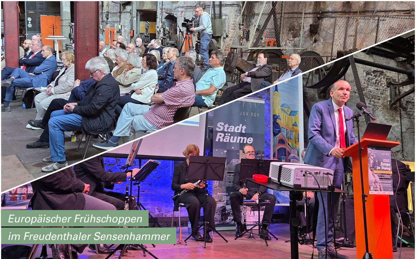
Europäischer Frühschoppen im Freudenthaler Sensenhammer