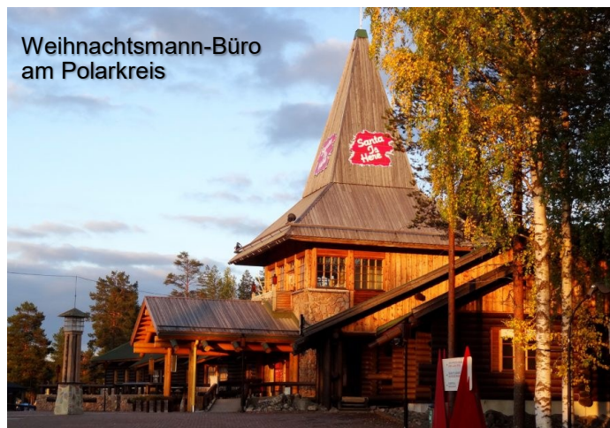
Weihnachtsmann-Büro am Polarkreis

Es besteht auch die Möglichkeit, den Weihnachtsmann in seinem Büro zu besuchen.