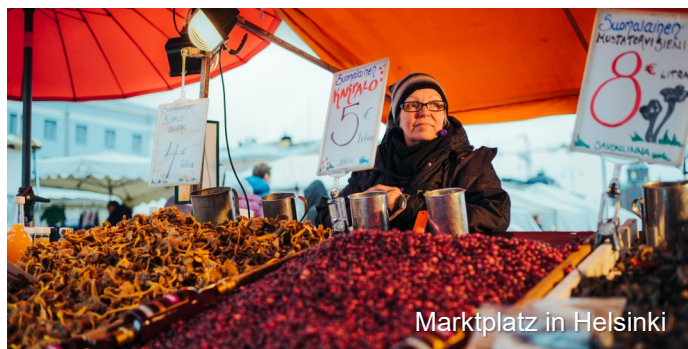
Marktplatz in Helsinki