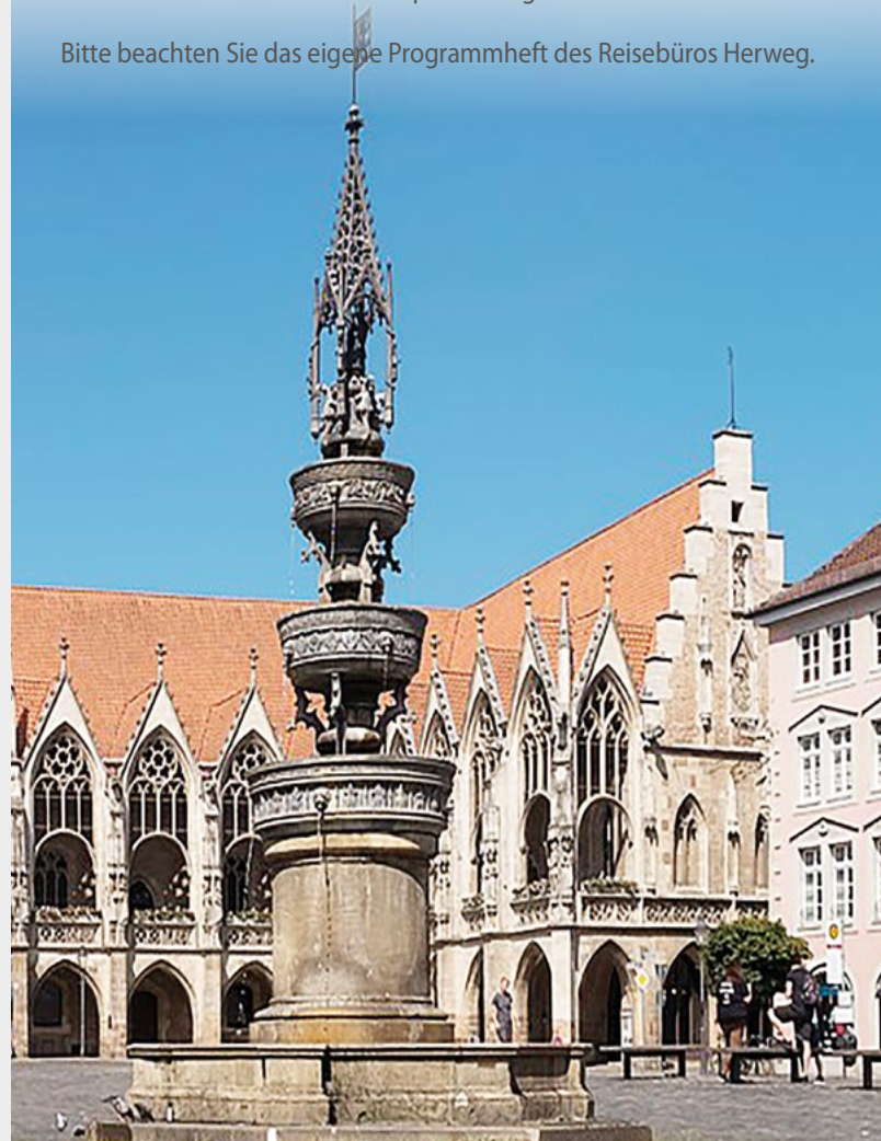
Foto: Altstadtmarkt in Braunschweig

Bitte beachten Sie das eigene Programmheft des Reisebüros Herweg.